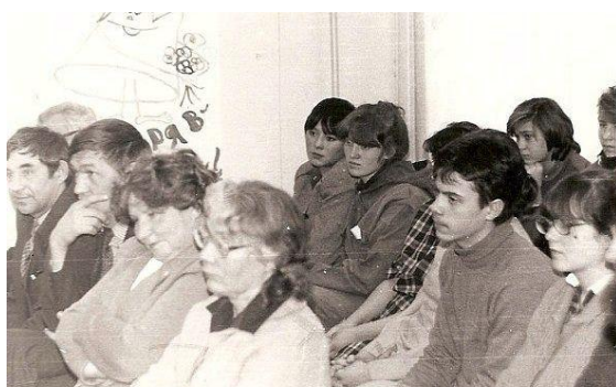
На комсомольском собрании