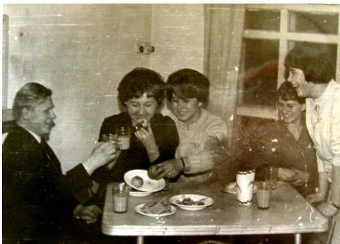
В кафе «Синяя птица».